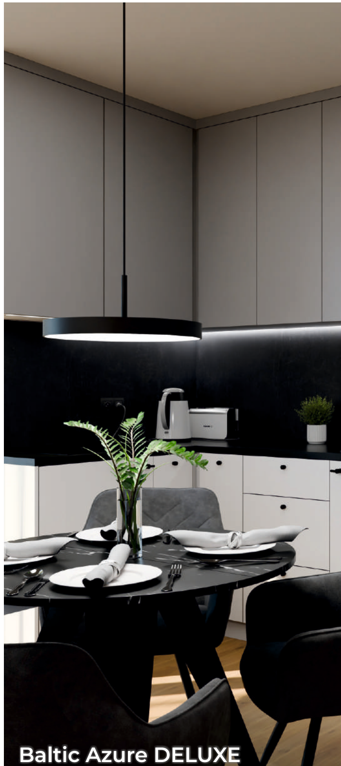
Baltic Azure DELUXE