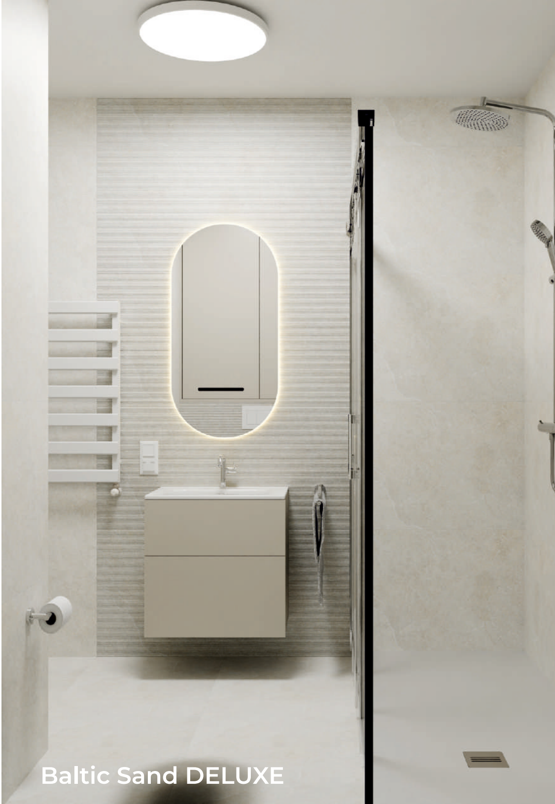
Baltic Sand DELUXE