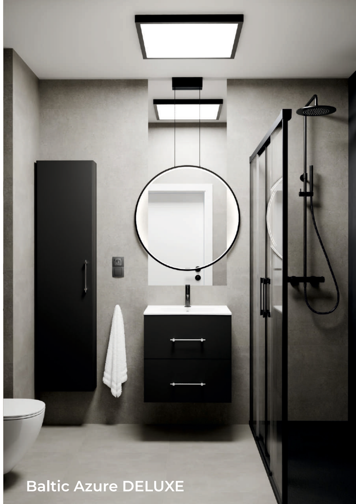
Baltic Azure DELUXE