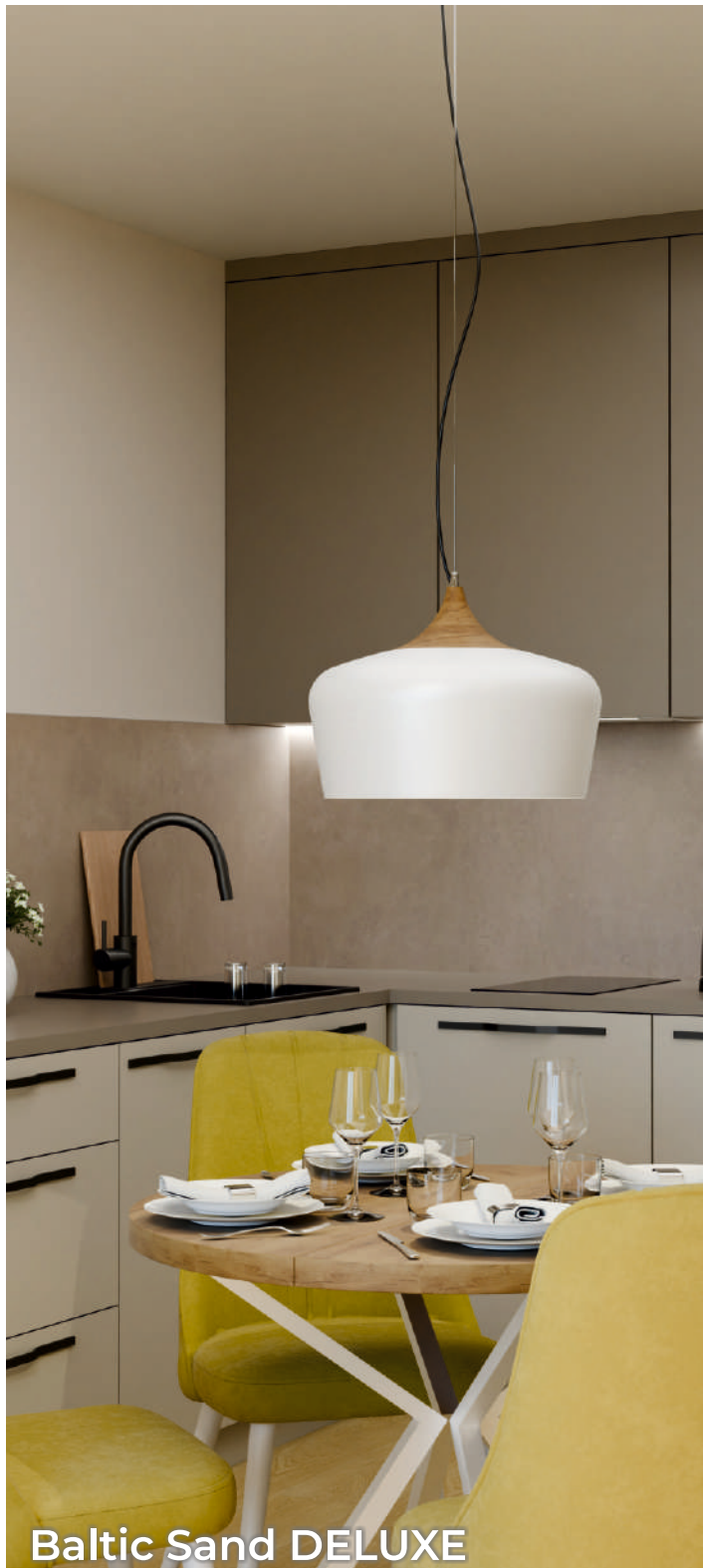
Baltic Sand DELUXE