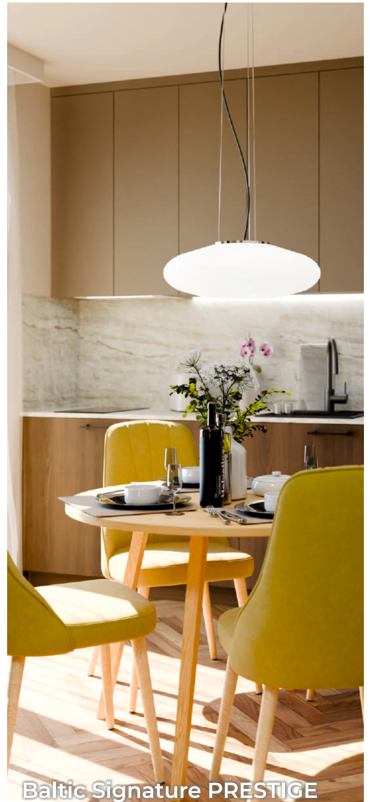
Baltic Signature PRESTIGE