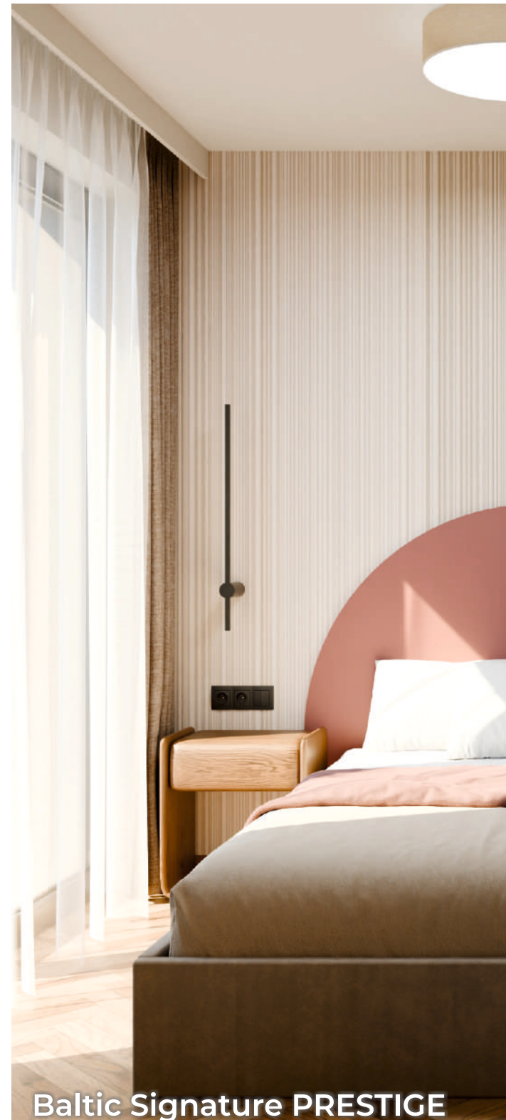
Baltic Signature PRESTIGE