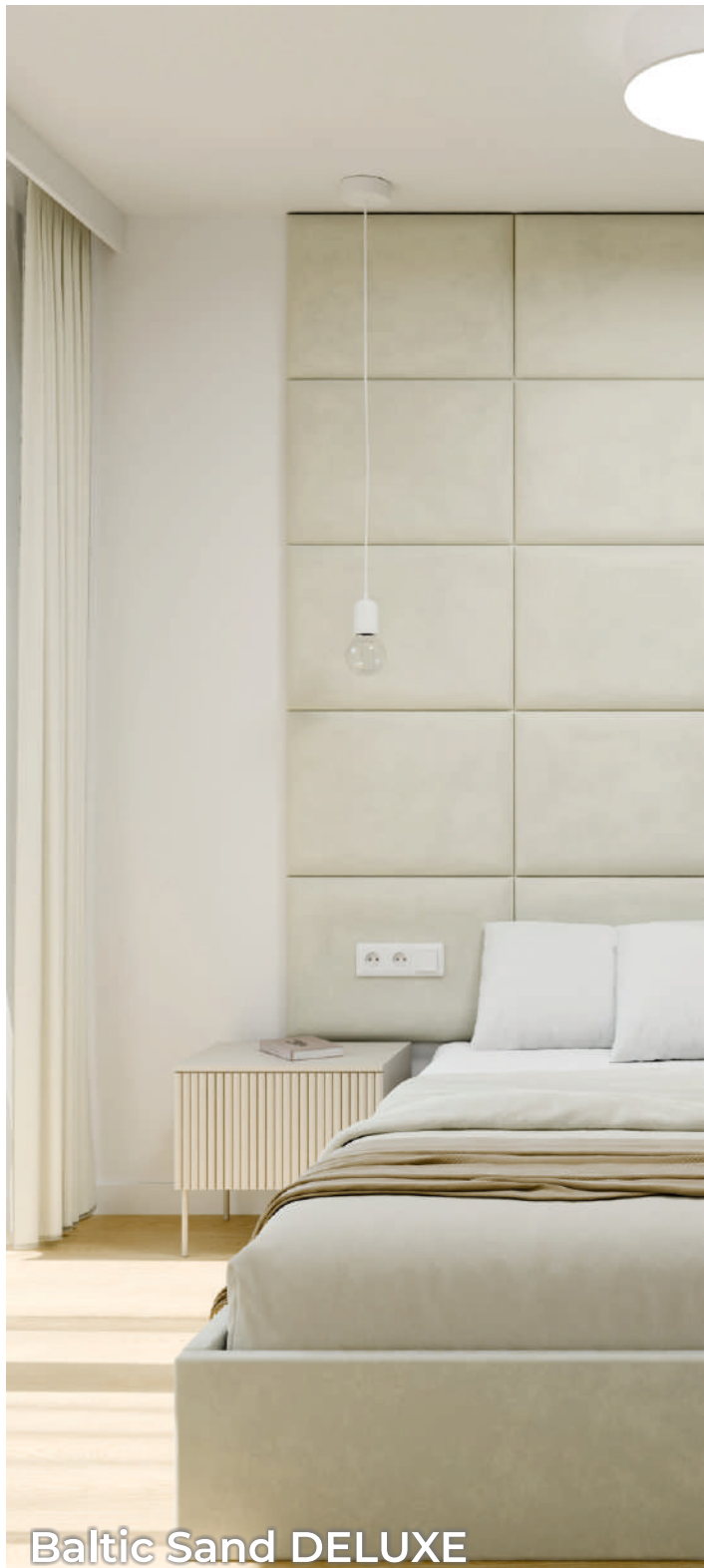
Baltic Sand DELUXE