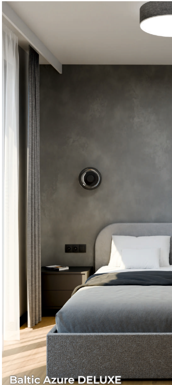
Baltic Azure DELUXE